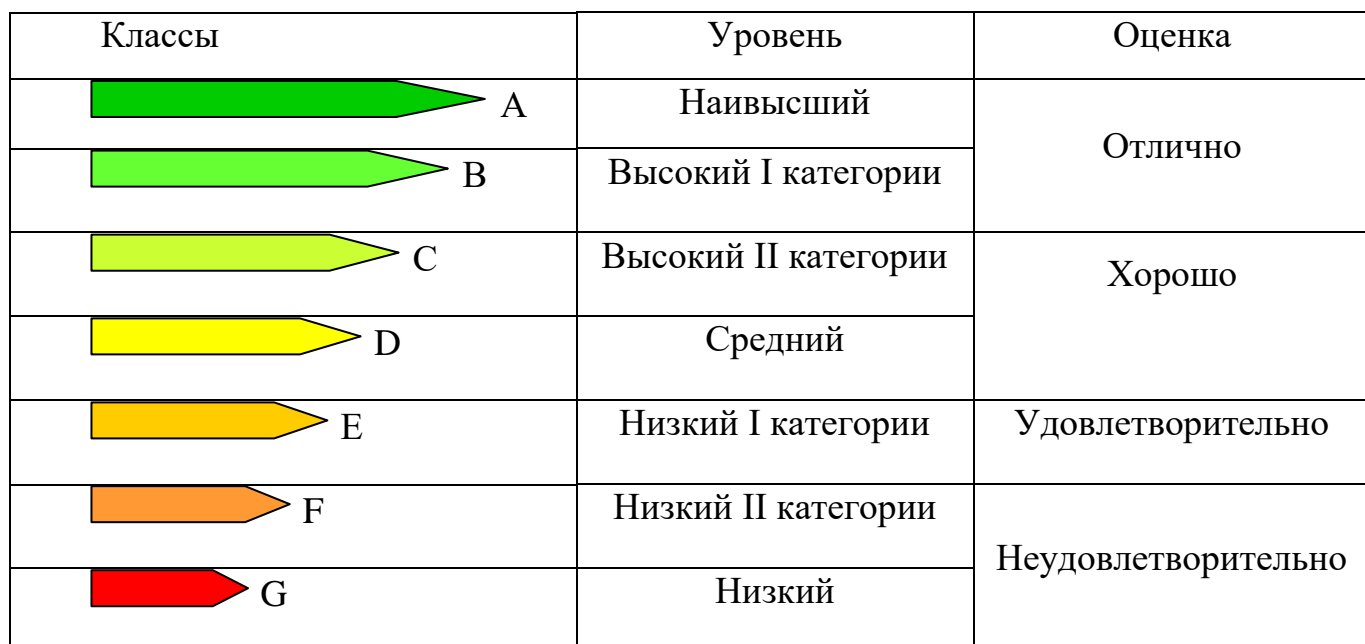
Таблица 3. Оценка дипломного проекта в соответствии с классом устойчивости среды обитания

5.4. В соответствии с присвоенным классом устойчивости среды обитания преподавателем выставляется оценка за дипломный проект по таблице 3.